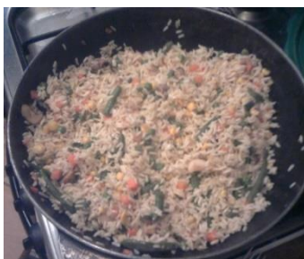
Рис с овощами